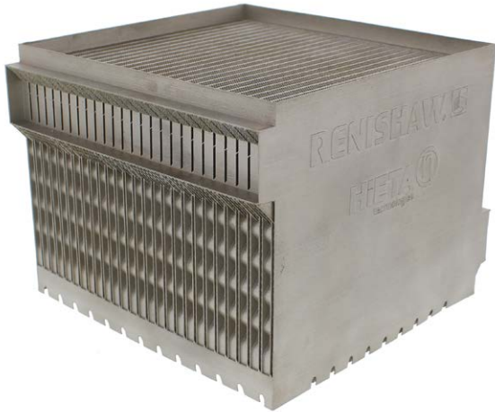
Proyecto de ampliador de alcance de microturbina, MITRE, intercambiador de calor en forma de cubo

HiETA cuenta en la actualidad con más de veinticinco empleados y una impresionante gama de instalaciones, que en conjunto pueden realizar el proceso completo de desarrollo de productos de FA, como el análisis de las necesidades del cliente y, a continuación, pasar del diseño inicial mediante paquetes computacionales de flujo dinámico (CFD) y análisis de elementos finitos (FEA), a la fabricación en los equipos Renishaw, ensayos y validación.