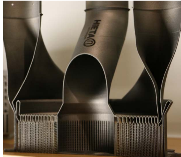
Sección transversal del recuperador SLAMMiT

El primer intento de fabricar un producto completo en la máquina AM250, generó un componente correcto, pero el tiempo de construcción fue de diecisiete días. Tras las mejoras de hardware y software, y la optimización de los parámetros del proceso, el plazo se redujo a ochenta horas. Las pruebas detalladas mostraron que el componente podía cumplir los requisitos de bajada de presión y transferencia térmica. Sin embargo, este rendimiento se consiguió con un peso y volumen aproximadamente 30% inferiores a una pieza equivalente fabricada con los métodos convencionales.