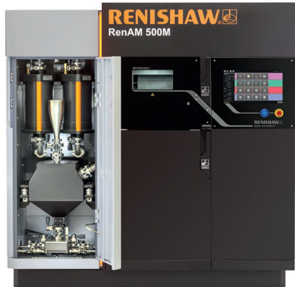
HiETA decidió invertir en un sistema más potente, RenAM 500M, para obtener una producción más rentable de componentes comerciales en tiradas cortas

HiETA ha elegido a Renishaw como socio y su sistema AM250 para una serie de proyectos. HiETA ha colaborado estrechamente con Renishaw en el desarrollo de juegos de parámetros específicos para producir paredes delgadas sin fugas en Inconel, con un grosor de tan solo 150 micras. Ambas empresas produjeron muestras con distintos ajustes en la máquina AM250, en las instalaciones de Renishaw de Stone, Staffordshire y en el sistema de HiETA en Bristol y Bath Science Park, cerca de Bristol, Reino Unido. Las muestras resultantes se sometieron a tratamiento térmico y, posteriormente, se clasificaron en HiETA y Renishaw. A raíz de los resultados de las pruebas, las empresas pudieron confirmar en las máquinas los parámetros óptimos de las estructuras de paredes delgadas, además, HiETA desarrolló