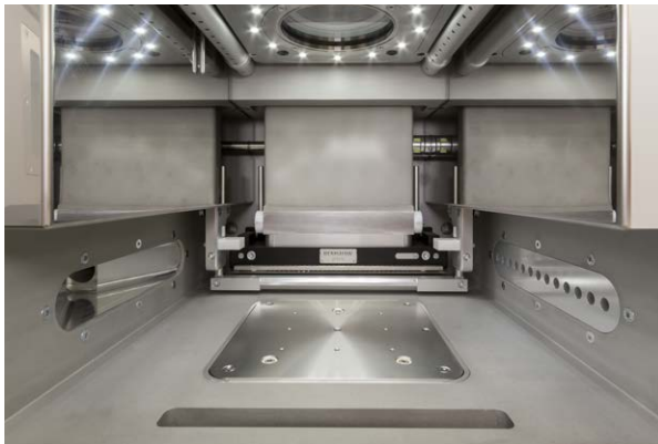
Cámara de construcción, sistema de fabricación aditiva metálica RenAM 500M

El tercer reto consistió en aplicar el conocimiento y la experiencia adquiridos para llevar el proceso desde la