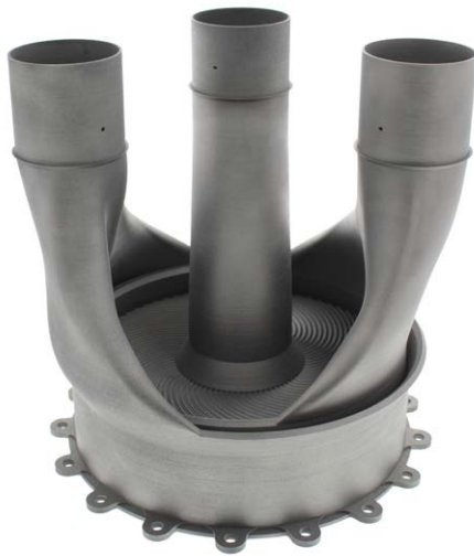
Recuperador SLAMMiT (Fundición Selectiva por Láser de Microturbinas)

Al mismo tiempo, Renishaw ha incluido mejoras en el software, para facilitar el proceso de grandes cantidades de datos, generados al dividir en finas capas el recuperador completo, y para crear las instrucciones de construcción necesarias para completar la pieza.